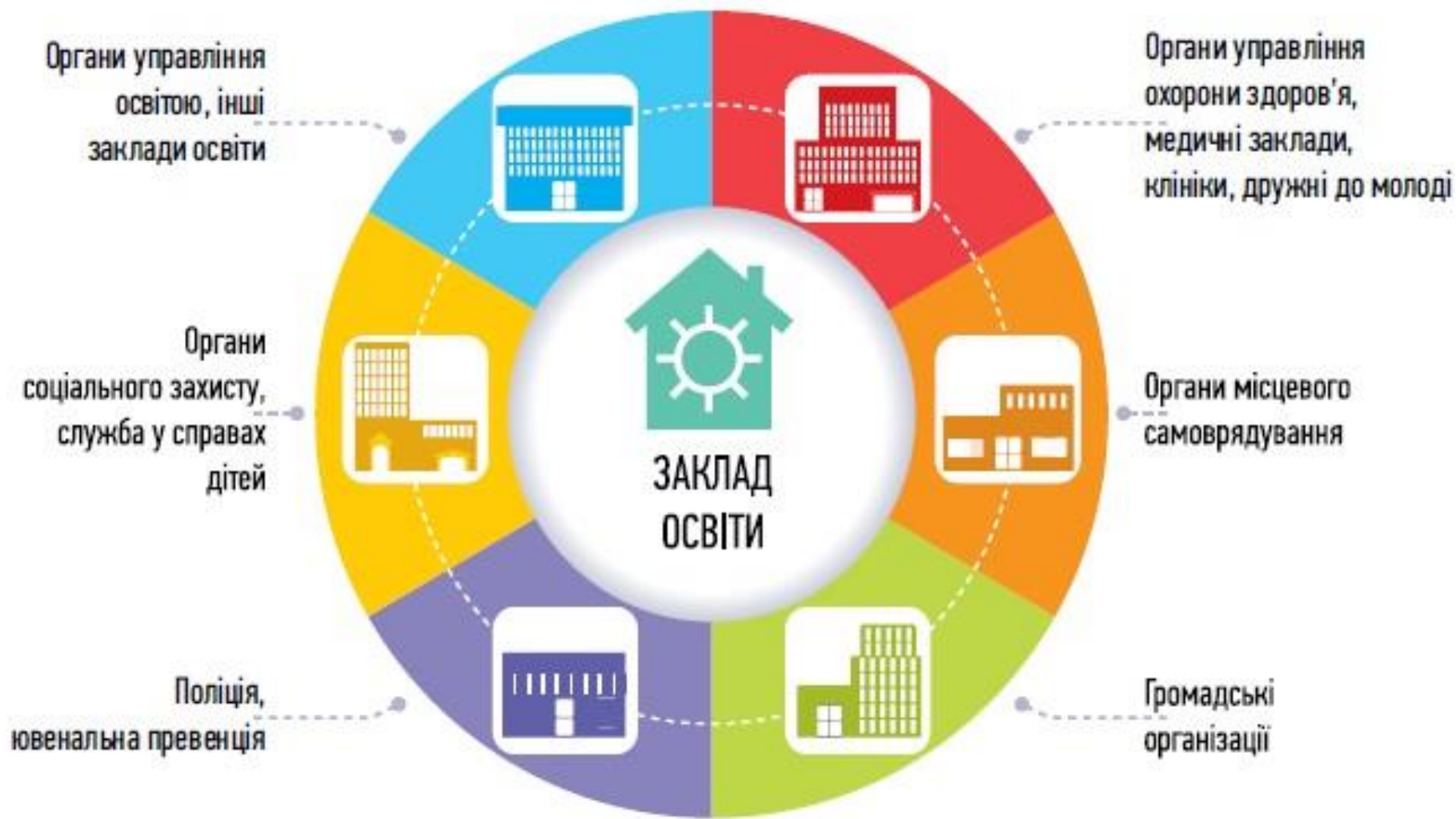
Суб'єкти взаємодії освітнього закладу з метою запобігання і реагування на випадки насильства